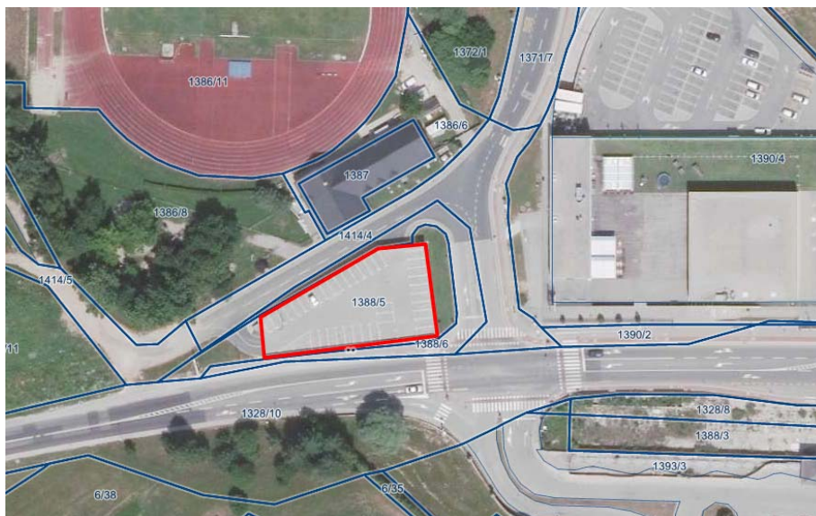
Lokacija 2: Garažni objekt v Portovalu

Slabosti lokacije: oddaljenost od mestnega jedra in lokacije obstoječe tržnice.