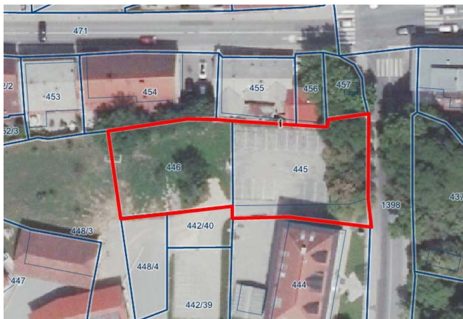
Lokacija 1: Parkirišče na Trdinovi ulici

Hkrati se lokacija nahaja v območju varovanja arheološke dediščine, zato je potrebno predhodno izdelati idejno zasnovo ureditve in k rešitvam pridobiti soglasje ZVKDS OE Novo mesto. V primeru, da bo ZVKD zahteval predhodne arheološke raziskave ali nadzor pri gradnji, so to dodatni stroški in potreben čas za izvedbo.